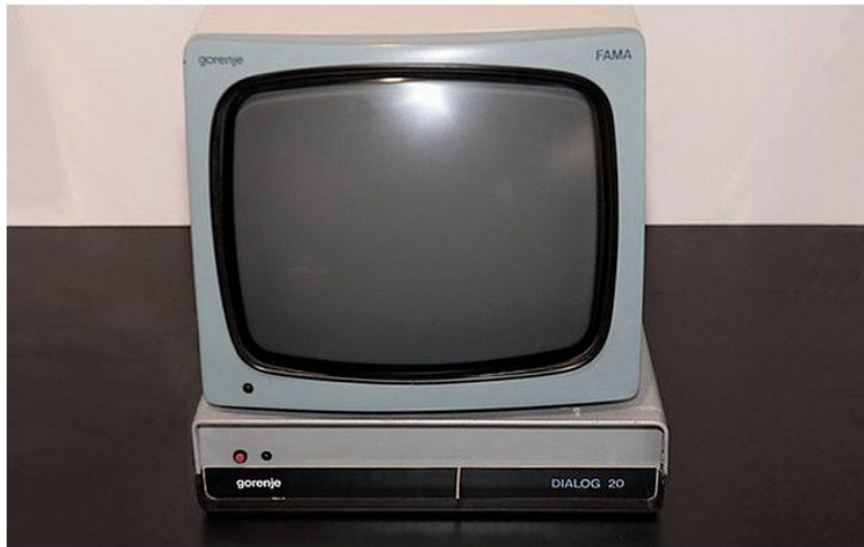
Mikroračunalnik Gorenje Dialog 20/H brez periferne opreme. Računalniški muzej.